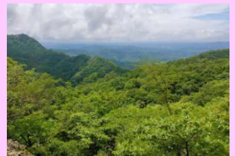
おかめ山東峰付近からの眺望