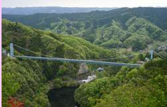
赤岩展望台からの眺望