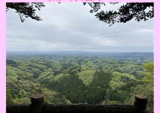
西金砂神社展望台からの眺望