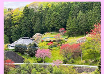
赤岩集落(花の景色)