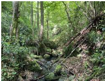
三葉峠の沢筋の登山道