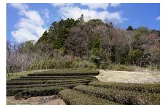
鷲の巣山登山口(山造)(C-29)