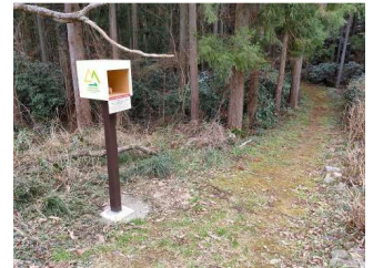
鷲の巣山登山口(下津原)(C-25)