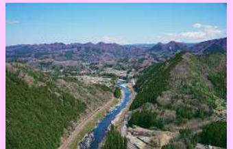
鷲の巣山山頂付近尾根からの眺望(C-28)