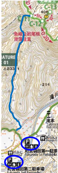
エスケープルート地図