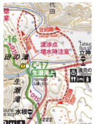
渡渉箇所(迂回路)地図