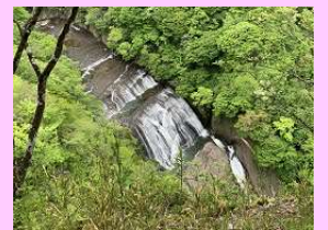
滝上展望台からの眺望(C-16)